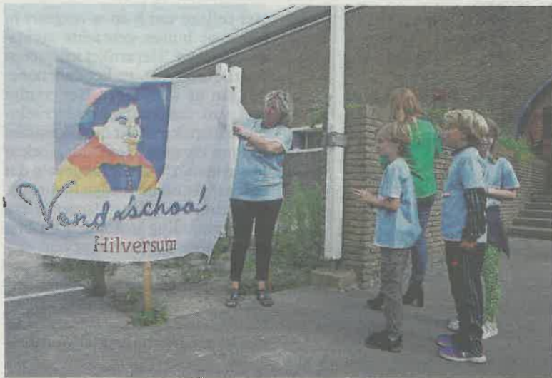
De vlag met de nieuwe naam Vondelschool gaat in top.

Met knallende confetti kanonnen en minicupcakes vieren de tweehonderd leerlingen van de basisschool maandagmiddag met hun leerkrachten en ouders de naamsverandering. De Elcerlyc locatie Schuttersweg gaat vanaf nu weer door het leven als de Vondelschool, vernoemd naar dichter Joost van den Vondel (1587-1679). En dat is de naam die de school in het monumentale pand van Dudok in de vorige eeuw decennialang droeg. De school ging in 1929 open. Veel oudere Hilversummers hebben leren lezen en schrijven op de Vondelschool.